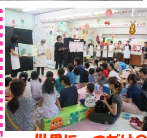
世界に一つだけのミニ絵本製作